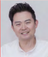
남, 지체장애, 대중음악