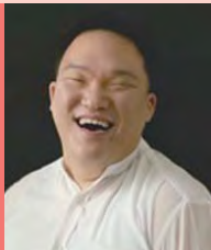
남, 뇌병변장애, 연극