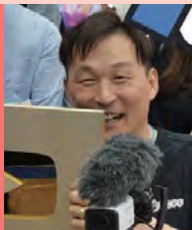
남, 지체장애, 영상