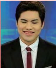
남, 시각장애, 방송