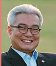
남, 지체장애, 대중음악