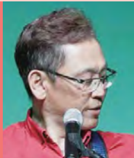
남, 지체장애, 대중음악