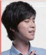
남, 시각장애, 대중음악