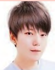
남, 지체장애, 작곡