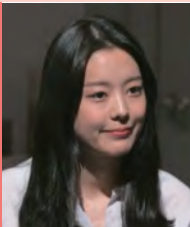
여, 청각장애, 연극영화