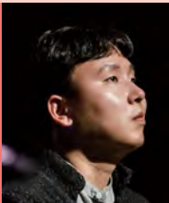
남, 시각장애, 대중음악