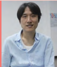
남, 지체장애, 대중음악