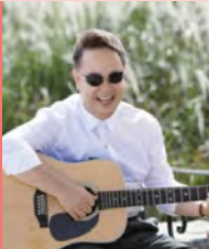
남, 시각장애, 대중음악