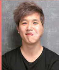
남, 안면장애, 대중음악