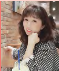
여, 뇌병변장애, 연극