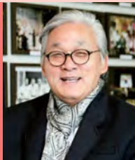
남, 지체장애, 대중음악