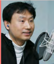
남, 시각장애, 방송