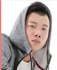
남, 지체장애, 비보잉