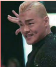
남, 지체장애, 무용