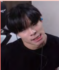
남, 뇌병변장애, 영상