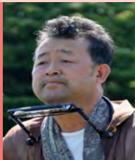
남, 지체장애, 대중음악