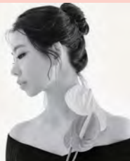
여, 청각장애, 무용