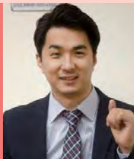
남, 지체장애, 방송