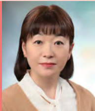
여, 지체장애, 방송