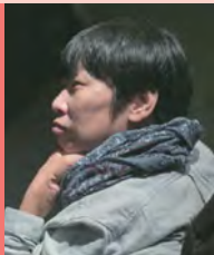
여, 지체장애, 연출