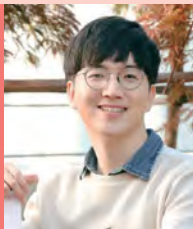
남, 뇌병변장애, 방송