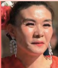
여, 시각장애, 무용