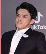
남, 지체장애, 연극