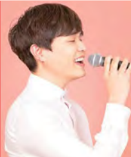
남, 시각장애, 대중음악