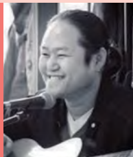
남, 지체장애, 대중음악