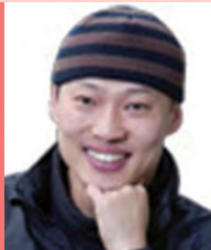
남, 지체장애, 행위예술