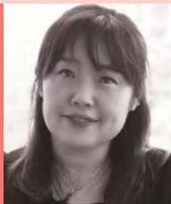
여, 지체장애, 영화