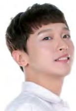
남, 청각장애, 영화