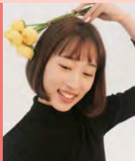
여, 시각장애, 영상