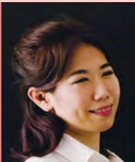
여, 지체장애, 무용