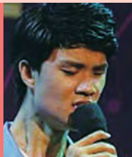
남, 시각장애, 대중음악