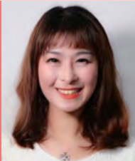
여, 뇌병변장애, 연극