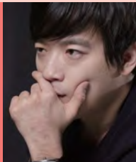
남, 뇌병변장애, 작곡