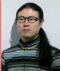
남, 시각장애, 무용