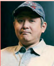
남, 지체장애, 영화연출