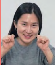
여, 청각장애, 연극