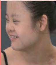
여, 지적장애, 발레