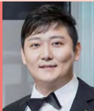
남, 지체장애, 대중음악