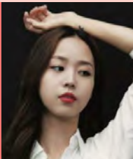
여, 청각장애, 무용