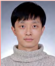
남, 지체장애, 무용