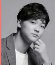
남, 청각장애, 모델