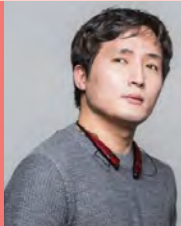
남, 시각장애, 영화연출