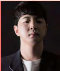
남, 지체장애, 마술