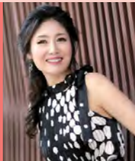
여, 시각장애, 대중음악