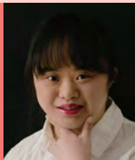
여, 자폐성장애, 무용