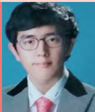
남, 뇌병변장애, 대중음악