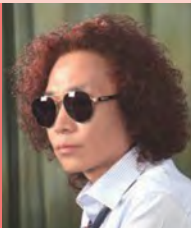
남, 시각장애, 대중음악