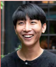
남, 시각장애, 영상