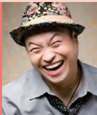
남, 뇌병변장애, 연극