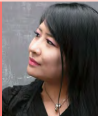
여, 지체장애, 대중음악