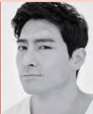
남, 안면장애, 모델