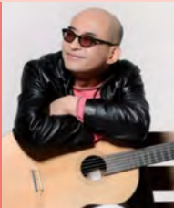
남, 지체장애, 대중음악