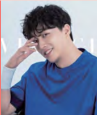
남, 지체장애, 영상