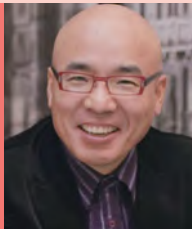
남, 지체장애, 방송