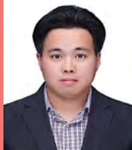
남, 자폐성장애, 문화콘텐츠평론