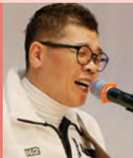
남, 지체장애, 대중음악