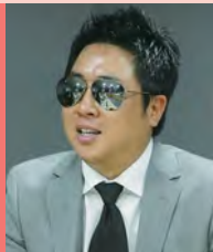
남, 시각장애, 방송