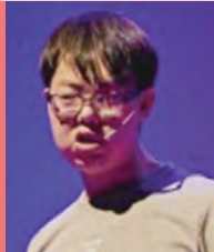
남, 뇌병변장애, 코미디