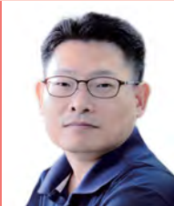
남, 지체장애, 영화연출