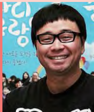
남, 지체장애, 방송