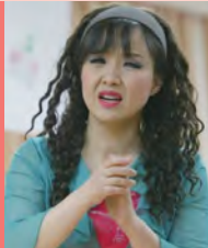
여, 청각장애, 수화뮤지컬