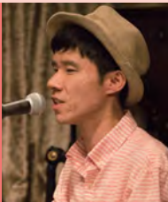
남, 시각장애, 대중음악