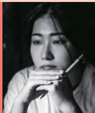
여, 청각장애, 뮤지컬 연출