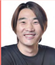
남, 지체장애, 무용