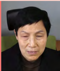
여, 시각장애, 연극