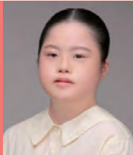
여, 지적&청각장애, 무용