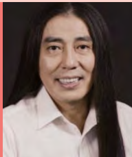
남, 지체장애, 영화