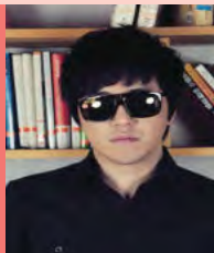
남, 시각장애, 대중음악