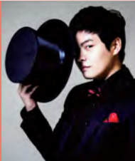
남, 지체장애, 미술