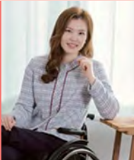
여, 지체장애, 방송