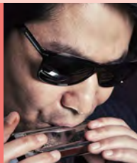
남, 시각장애, 하모니카 연주