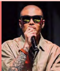
남, 지체장애, Host MC