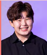
여, 지체장애, 연극연출