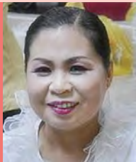
여, 지체장애, 무용