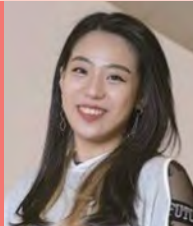
여, 지체장애, 무용