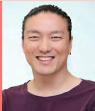
남, 지체장애, 무용