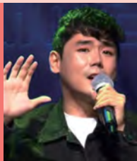
남, 지체장애, 대중음악