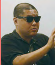
남, 시각&amp;신장장애, 영화연출