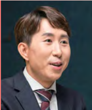
남, 지체장애, 방송