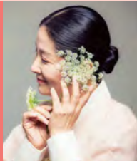
여, 청각장애, 무용