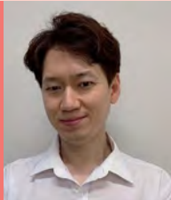
남, 시각장애, 연극