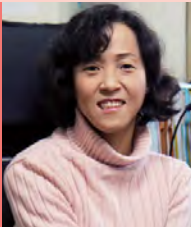
여, 뇌병변장애, 연극