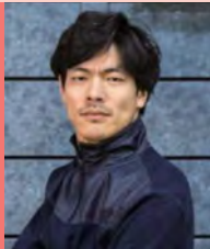
남, 뇌병변장애, 연극