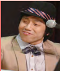
남, 시각장애, 대중음악