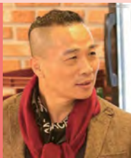
남, 지체장애, 대중음악