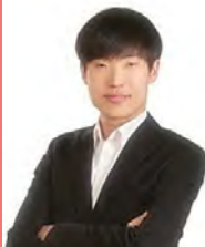
남, 시각장애, 무용