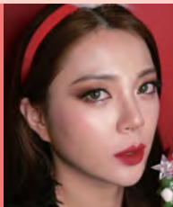
여, 지체장애, 영상