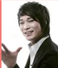
남, 지체장애, 미술