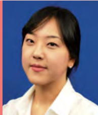
여, 지체장애, 방송