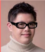
남, 지적장애, 영화