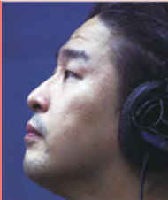
남, 지체장애, 방송