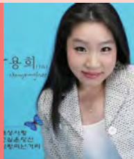
여, 지체장애, 대중음악