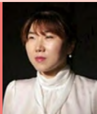
여, 시각장애, 무용