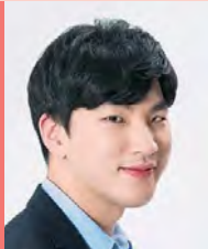
남, 뇌병변장애, 모델