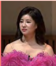
여, 지체장애, 무용