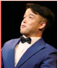
남, 지체장애, 연극