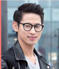
남, 청각장애, 모델