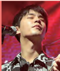
남, 시각장애, 대중음악