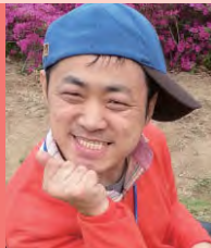
남, 뇌병변장애, 영화연출