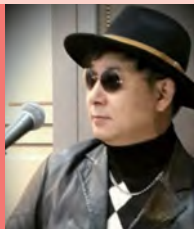
남, 지체장애, 대중음악