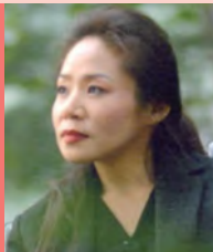
여, 지체장애, 대중음악