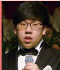
남, 지체, 지적, 시각장애, 대중음악