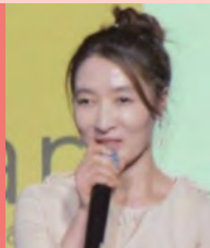
여, 시각장애, 무용