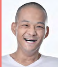
남, 뇌병변장애, 행위예술