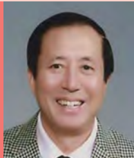
남, 지체장애, 연출