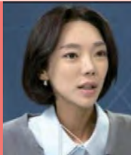
여, 지체장애, 피트니스모델