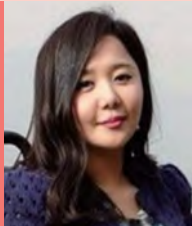
여, 지체장애, 방송