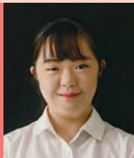
여, 지적장애, 무용