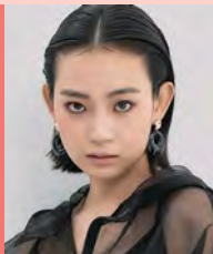
여, 청각장애, 모델