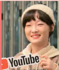
여, 뇌병변장애, 영상