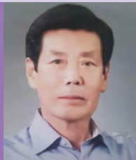
남, 지체장애, 공예