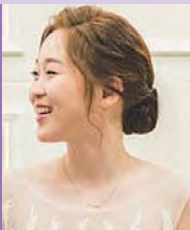
여, 청각장애, 웹툰