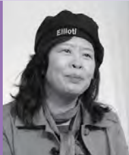
여, 청각장애, 한국화