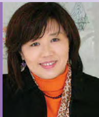
여, 지체장애, 서양화