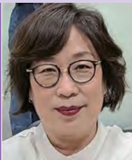
여, 지체장애, 서양화