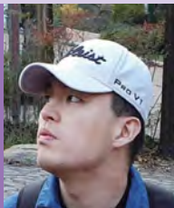
남, 지적장애, 서양화