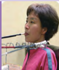
여, 지체장애, 서양화