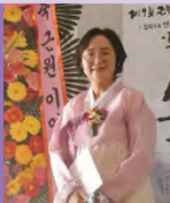
여, 청각장애, 서예