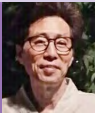
남, 지체장애, 한국화