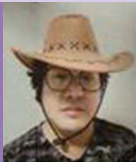
남, 지체장애, 한국화