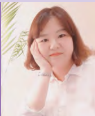
여, 지체장애, 웹툰