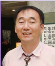
남, 청각장애, 서예