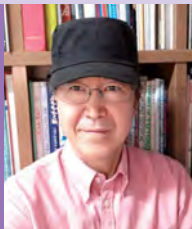
남, 청각장애, 서양화