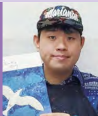
남 자폐성장애, 서양화