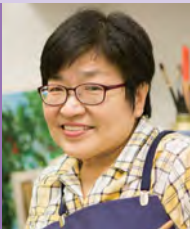
여, 지체장애, 서양화