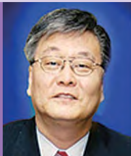
남, 지체장애, 서양화