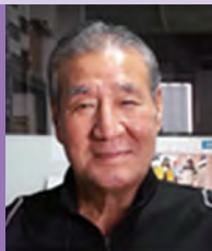
남, 지체장애, 서양화