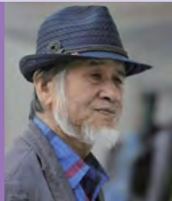
남, 청각장애, 서양화