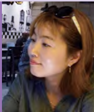
여, 지체장애, 서양화