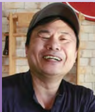
남, 시각장애, 조각