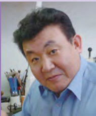
남, 지체장애, 목공예