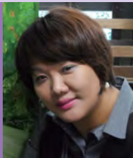
여, 지체장애, 서양화