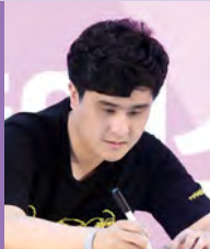
남, 자폐성장애, 비구상