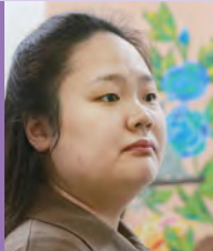
여, 자폐성장애, 서양화