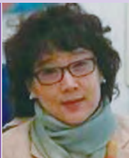
여, 지체장애, 서양화