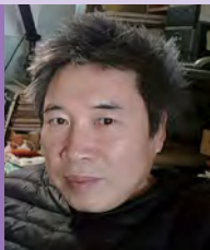
남, 지체장애, 서양화