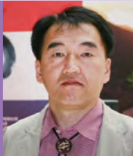
남, 청각장애, 동양화