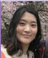
여, 청각장애, 조각