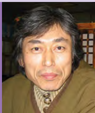
남, 지체장애, 한국화