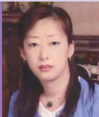
여, 지체장애, 한국화