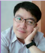
남, 지체, 시각장애, 사진