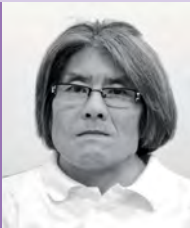
남, 지체장애, 서양화