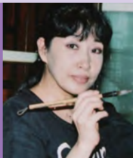
여, 지체장애, 서양화