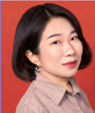
여, 지체장애, 디자인