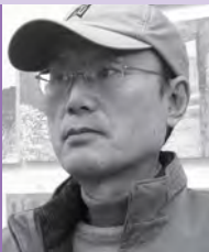
남, 지체장애, 서양화