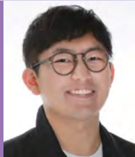
남, 자폐성장애, 서양화