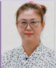
여, 지체장애, 서양화