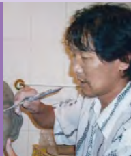
남, 지체장애, 공예