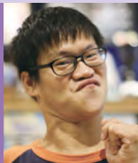
남, 뇌병변장애, 서양화