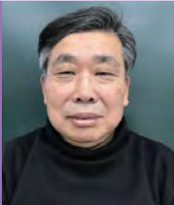
남, 청각장애, 한국화