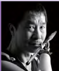
남, 지체장애, 수묵크로키