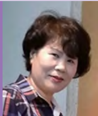
여, 청각장애, 한국화