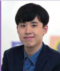
남, 지적장애, 서양화