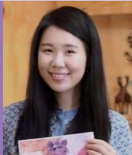
여, 청각장애, 일러스트