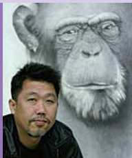
남, 지체장애, 한국화