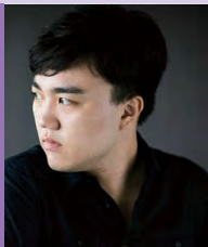
남, 자폐성장애, 서양화