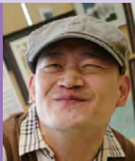
남, 뇌병변장애, 서양화