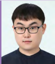
남, 자폐성장애, 서양화