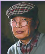
남, 지체장애, 공예