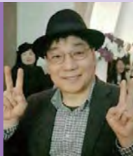
남, 지체장애, 서양화