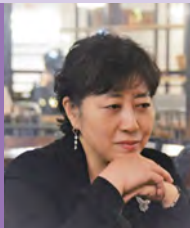
여, 지체장애, 서양화