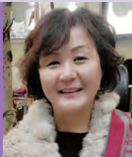
여, 지체장애, 조각