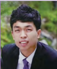
남, 자폐성장애, 서양화