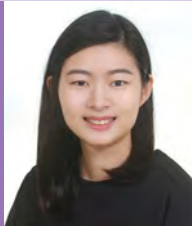
여, 청각장애, 서양화