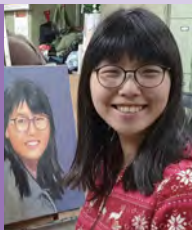
여, 자폐성장애, 서양화