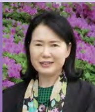
여, 지체장애, 서양화