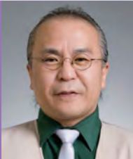
남, 지체장애, 사진