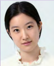
여, 자폐성장애, 서양화