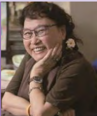
여, 지체장애, 만화