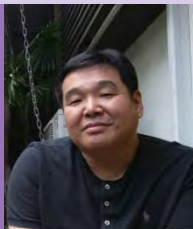
남, 지체장애, 한국화