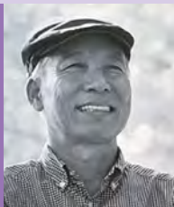
남, 청각장애, 서양화