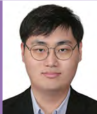
남, 자폐성장애, 서양화