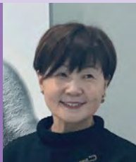
여, 지체장애, 서양화