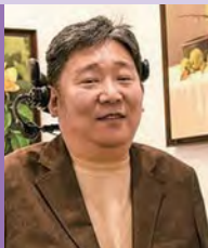
남, 지체장애, 서양화