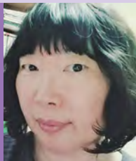
여, 지체장애, 서양화