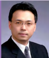
남, 지체장애, 공예