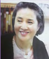
여, 지체장애, 서예