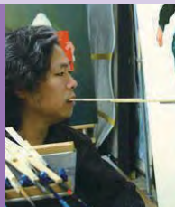
남, 지체장애, 서양화