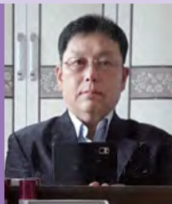
남, 지체장애, 서예