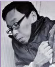
남, 지체장애, 만화