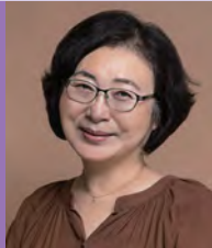
여, 지체장애, 서양화