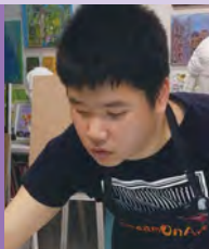
남, 자폐성&청각장애, 서양화