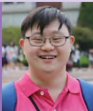
남, 지적장애, 픽셀아트드로잉