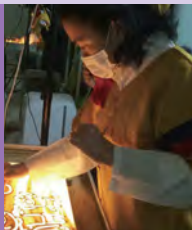
여, 지적장애, 서양화