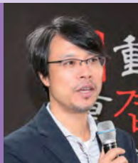
남, 지체장애, 사진