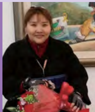
여, 지체장애, 서양화