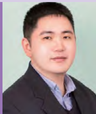
남, 자폐성장애, 서양화