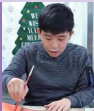
남, 자폐성장애, 서양화