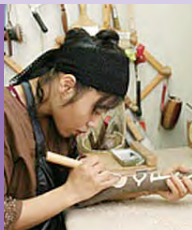
여, 지체장애, 목공예