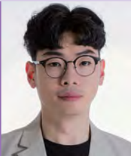
남, 뇌병변장애, 서양화