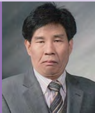
남, 뇌병변장애, 사진