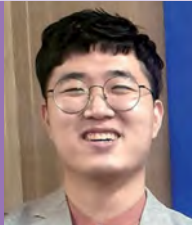
남, 자폐성장애, 서양화