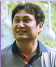
남, 지체장애, 서양화