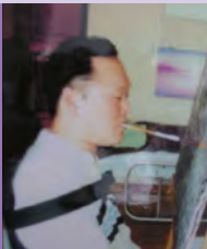
남, 지체장애, 서양화