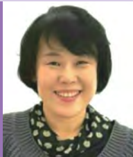
여, 지체장애, 서양화