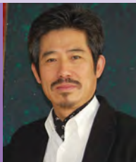
남, 청각장애, 서양화