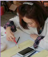
여, 지체장애, 서양화