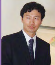
남, 청각장애, 한국화