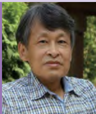
남, 지체장애, 도예