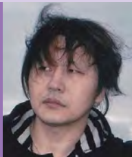
남, 지체장애, 서양화