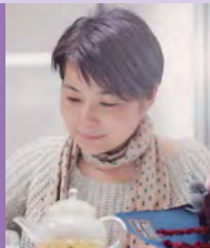
여, 지체장애, 캘리그래퍼