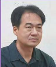
남, 청각장애, 동양화