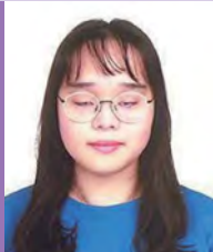
여, 시각장애, 서양화