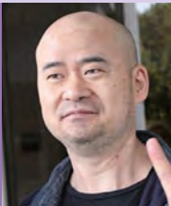
남, 청각장애, 만화