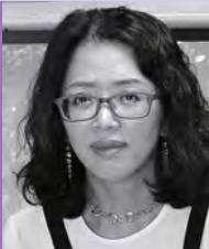
여, 청각장애, 서양화