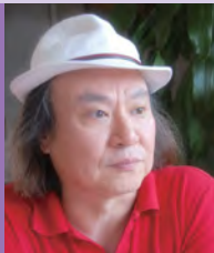
남, 지체장애, 서양화