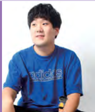
남, 자폐성장애, 서양화