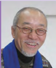
남, 지체장애, 디자인