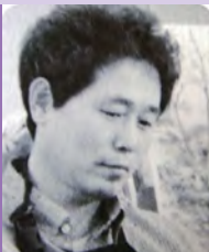
남, 지체장애, 한국화