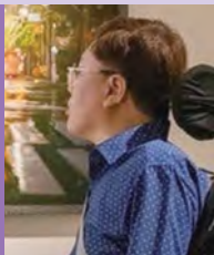
남, 지체장애, 서양화