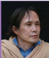
남, 지체장애, 조각가