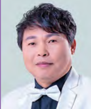
남, 지체장애, 한국화