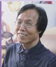
남, 지체장애, 만화