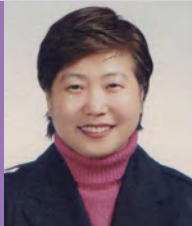
여, 뇌병변장애, 서양화