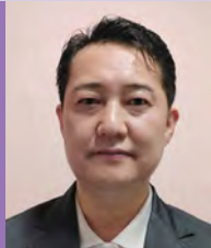
남, 지체장애, 조각