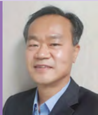
남, 청각장애, 서양화