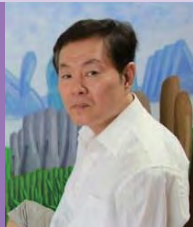
남, 지체장애, 서양화