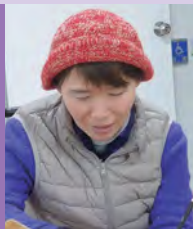
여, 지체장애, 서양화