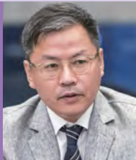
남, 지체장애, 디자인