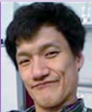
남, 뇌병변장애, 서양화