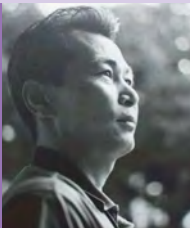
남, 지체장애, 전각