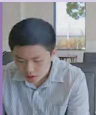
남, 지적장애, 서양화