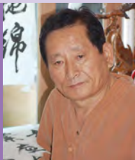
남, 지체장애, 서예