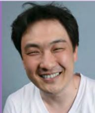
남, 청각장애, 서양화