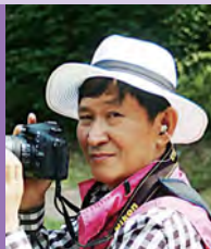
남, 지체장애, 서양화