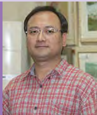
남, 청각장애, 서양화