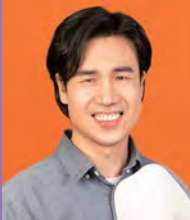
남, 시각장애, 별론아트