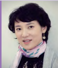
여, 지체장애, 동양화