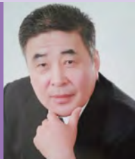
남, 지체장애, 서예