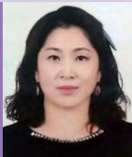
여, 지체장애, 서양화