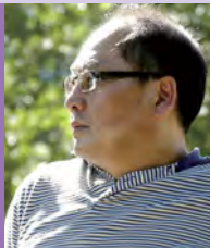
남, 지체장애, 동양화