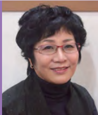
여, 지체장애, 서양화