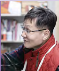
남, 지체장애, 서양화