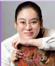
여, 지적장애, 서양화