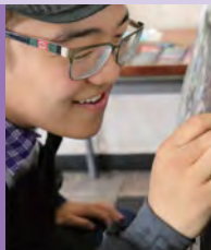
남, 자폐성장애, 서양화