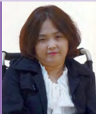
여, 지체장애, 민화