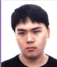
남, 시각장애, 서양화