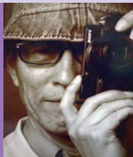
남, 시각장애, 사진