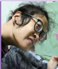
여, 뇌병변장애, 서양화