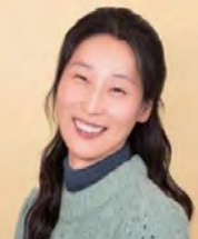
여, 뇌병변장애, 사진