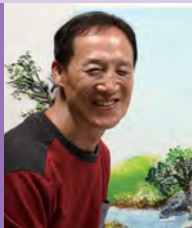
남, 시각장애, 서양화