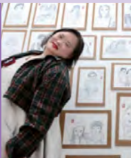
여, 지적장애, 캐리커처