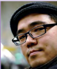
남, 시각장애, 사진