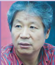
남, 지체장애, 서화전각