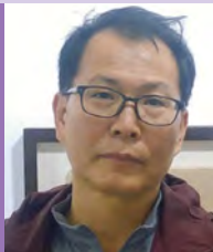
남, 지체장애, 서양화