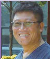
남, 시각장애, 서양화