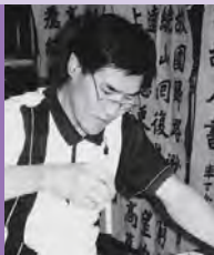
남, 지체장애, 서예