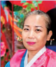
여, 지체장애, 자수공예