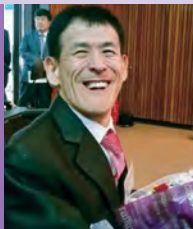
남, 뇌병변장애, 서양화