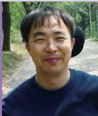
남, 지체장애, 서양화