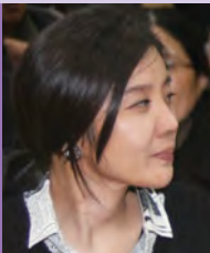
여, 지체장애, 동양화