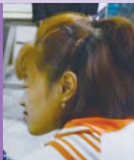
여, 뇌병변장애, 서양화