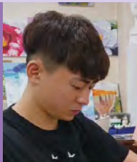
남, 발달장애, 서양화